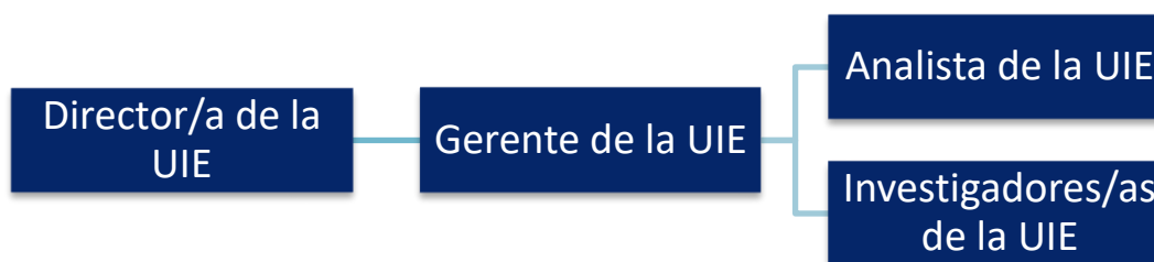
Ilustración 1. Estructura de la Unidad de Investigaciones Especiales.

El analista de la UIE realiza la recopilación y el análisis preliminar de datos para las investigaciones que llevarán a cabo los investigadores de la UIE. Cuando llegan los resultados de la investigación preliminar de los analistas de la UIE, los investigadores evalúan los historiales clínicos y realizan las investigaciones finales. La ilustración muestra la organización de la UIE.